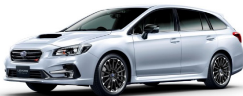
2.0 STI Sport Black Selection