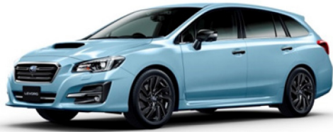
1.6GT-S EyeSight Advantage Line