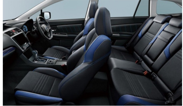
1.6GT-S EyeSight Advantage Line インテリア