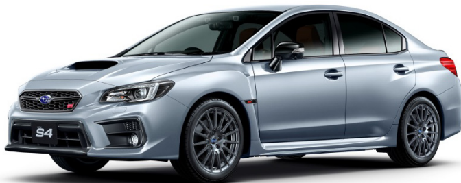
WRX S4 STI Sport エクステリア

*1: スバルテクニカインターナショナル株式会社(代表: 平川良夫、東京都三鷹市、略称: STI)