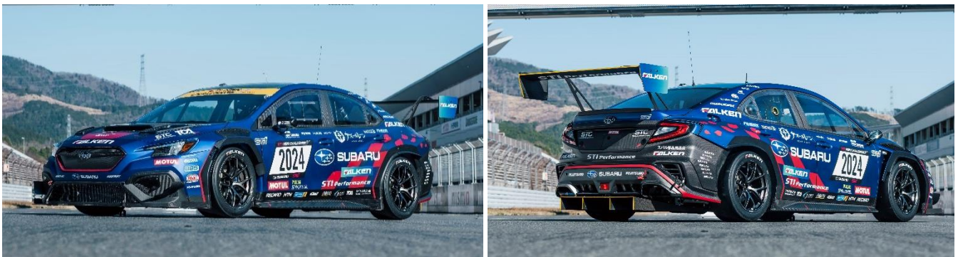
SUBARU WRX NBR CHALLENGE 2024

SUBARU のモータースポーツ統括会社であるスバルテクニカインターナショナル*1 は、2024 年 5 月 30 日から 6 月 2 日にかけてドイツ・ラインラント＝プファルツ州アイフェル地方のニュルブルクリンクサーキットで開催される第 52 回ニュルブルクリンク 24 時間レースに、『WRX S4』をベースとする車両で参戦します。このチャレンジは、2008 年以来今年で 15 回目*2 となります。