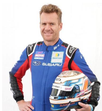
カルロ・ヴァン・ダム