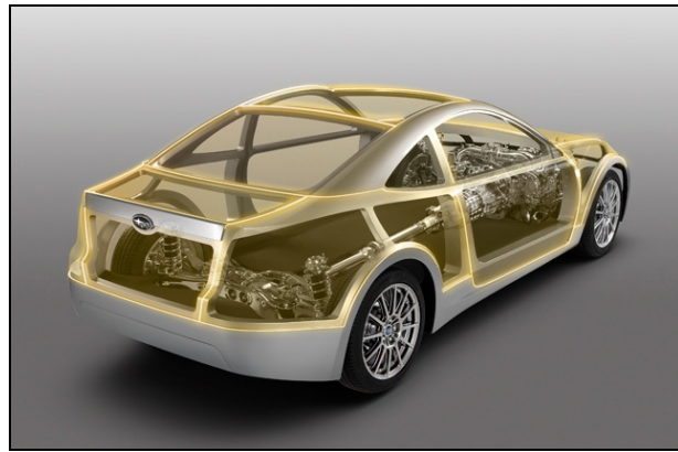
SUBARU BRZ PROLOGUE(技術展示)

BRZ PROLOGUE (ビィ アール ゼット プロローグ) は、現在、トヨタ自動車(株)と共同開発中の新世代 FR スポーকার(SUBARU BRZ)の新しい走りを支える技術コンセプトです。FR スポーカースポーツカーの特長を最大限に引き出すことを目指し、スバルのコア技術である水平対向(ボクサー)エンジンを核とした車両開発技術をもとに、新たに開発したFRレイアウトの技術として提案します。